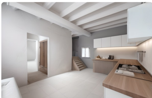
Projection virtuelle non contractuelle