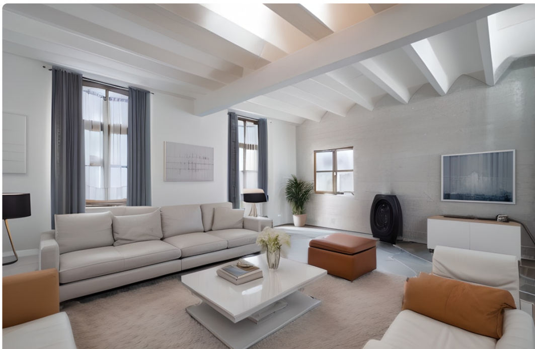
Projection virtuelle non contractuelle